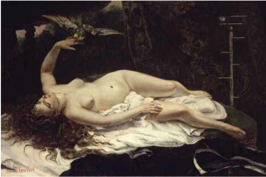
Fig. 2. Jean-Désiré-Gustave Courbet, Mujer con un loro , 1866. Óleo sobre tela, 129.5 x 195.6 cm. Museo Metropolitano de Arte, Nueva York, Nueva York, Estados Unidos.