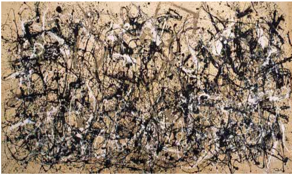
Fig. 4. Jackson Pollock, Autumn Rhythm (Number 30) , 1950. Esmalte sobre tela, 266.7 x 525.8 cm. Museo Metropolitano de Arte, Nueva York, Nueva York, Estados Unidos.