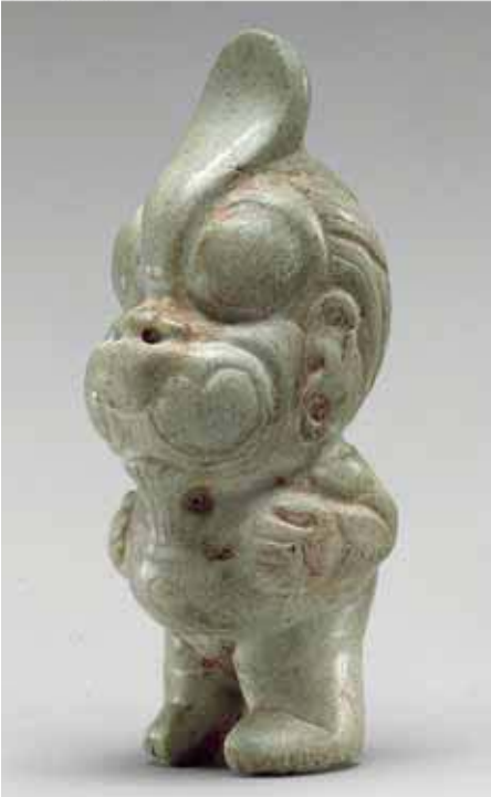
Fig. 1. Figura transformándose en águila. Olmeca, siglos X-VI a.C. Jade, altura 11.4 cm. Museo Metropolitano de Arte, Nueva York, Nueva York, Estados Unidos.