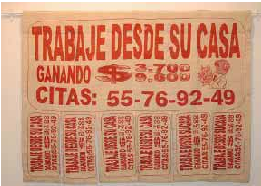
Fig. 5. Gabriel Kuri, Trabaje desde su casa , 2003. Lana tejida a mano, 180 x 250 cm.