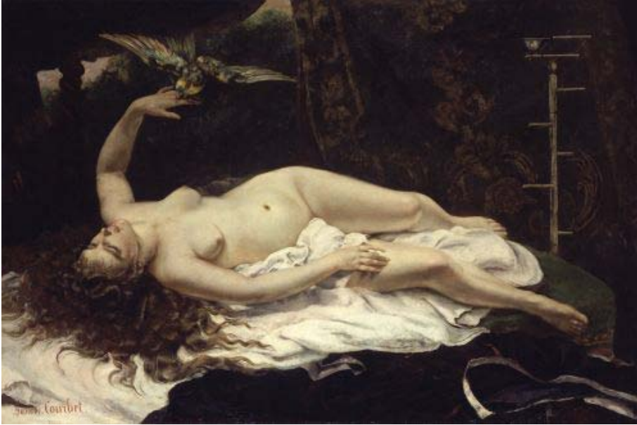
Fig. 2. Jean-Désiré-Gustave Courbet, Mujer con un loro , 1866. Oleo sobre tela, 129.5 x 195.6 cm. Museo Metropolitano de Arte, Nueva York, Nueva York, Estados Unidos.