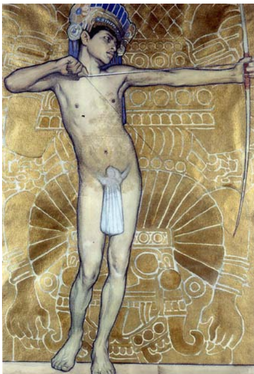
Fig. 3. Saturnino Herrán, El flechador , 1918. Acuarela y lápiz sobre papel, 57.5 x 39.5 cm.