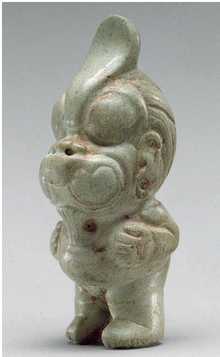
Fig. 1. Figura transformándose en águila. Olmeca, siglos X–VI a.C. Jade, altura 11.4 cm. Museo Metropolitano de Arte, Nueva York, Nueva York, Estados Unidos.