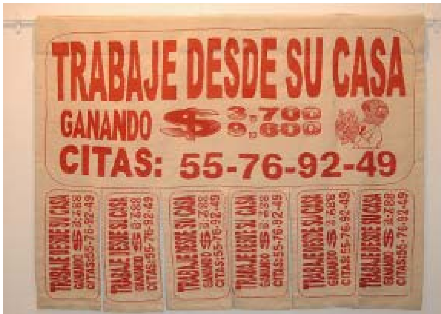
Fig. 5. Gabriel Kuri, Trabaje desde su casa , 2003. Lana tejida a mano. 180 x 250 cm.