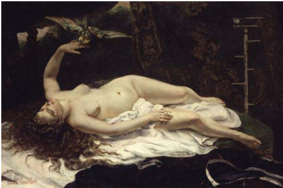
Fig. 2. Jean-Désiré-Gustave Courbet, Mujer con un loro , 1866. Oleo sobre tela, 129.5 x 195.6 cm. Museo Metropolitano de Arte, Nueva York, Nueva York, Estados Unidos.