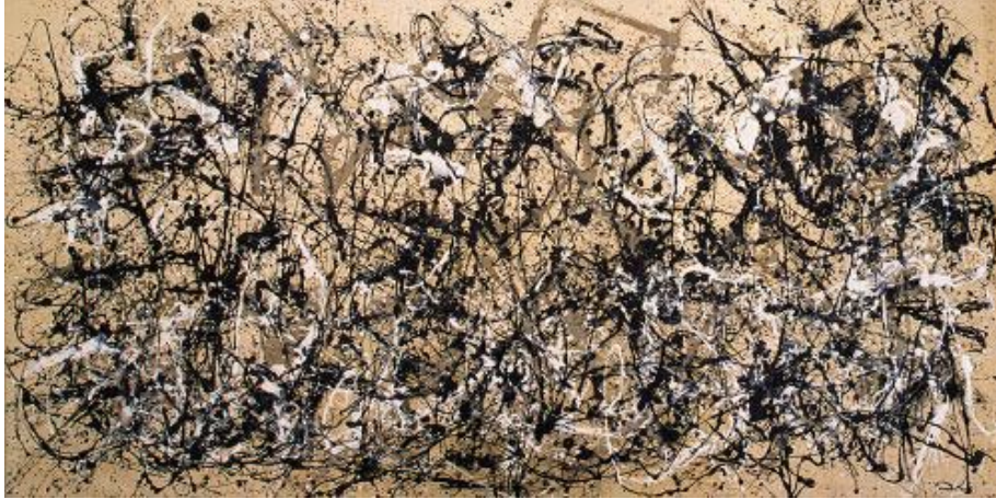
Fig. 4. Jackson Pollock, Autumn Rhythm (Number 30) , 1950. Esmalte sobre tela, 266.7 x 525.8 cm. Museo Metropolitano de Arte, Nueva York, Nueva York, Estados Unidos.